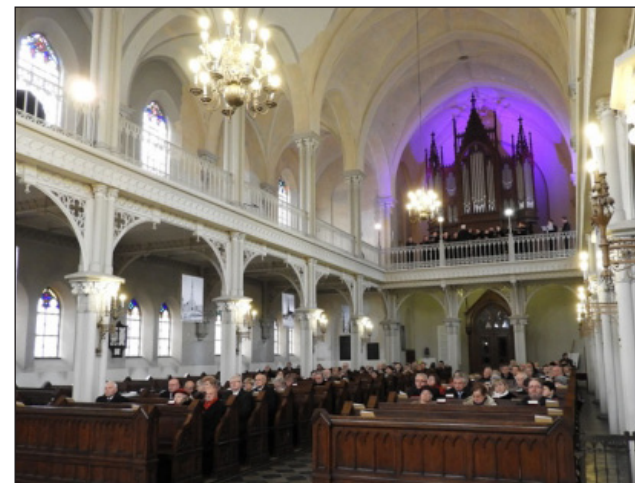
Obchody jubileuszowe.

Szerszą relację z uroczystości można przeczytać w JEDNOCIE nr 4/2016, fotorelacja i nagrania dźwiękowe - na stronie internetowej parafii: www.reformowani.org.pl .