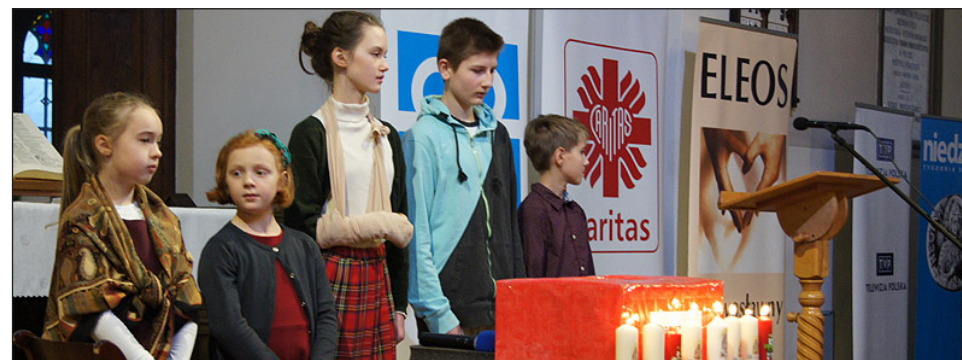
Dzieci ze Szkoły Niedzielnej podczas inauguracji Wigilijnego Dzieła. Fot. Archiwum

26 listopada po południu odbyło się w naszym kościele uroczyste nabożeństwo inaugurujące Wigilijne Dzieło Pomocy Dzieciom. Podczas nabożeństwa wystąpiły dzieci ze Szkoły Niedzielnej i „Zelowskie Dzwonki”. Szersza relacja z wydarzenia - w JEDNOCIE 4/2016 wraz z fotorelacją. Obszerna fotorelacja znajduje się również na stronie internetowej parafii.